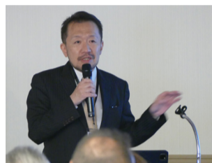
「コウノドリ」モデルになった産科医荻田先生

秋晴れの中、大阪府泉佐野市のスターゲイトホテル関西エアポートに全国から321名が集まり、2日間にわたり、第18回(公社)日本鍼灸師会全国大会 in 近畿が開かれました。今回は、単独開催ではなく初めて近畿ブロック7師会による共同開催と鍼灸の普及を目的とした市民参加型として縁日を盛り込んだ、新しい試みを取り入れた大会にしました。