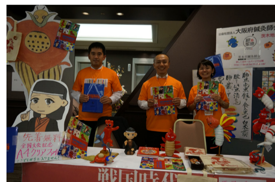
大阪ハラノムシスタッフ

緑日では金魚すくいやストラックアウト・型抜き・ルーレットビンゴ等を各師会が担当し、大阪は豊中地域の先生方中心にバスケットボールビンゴを行いました。さらに茨木地域の先生方にはハラノムシの展示をして頂きました。