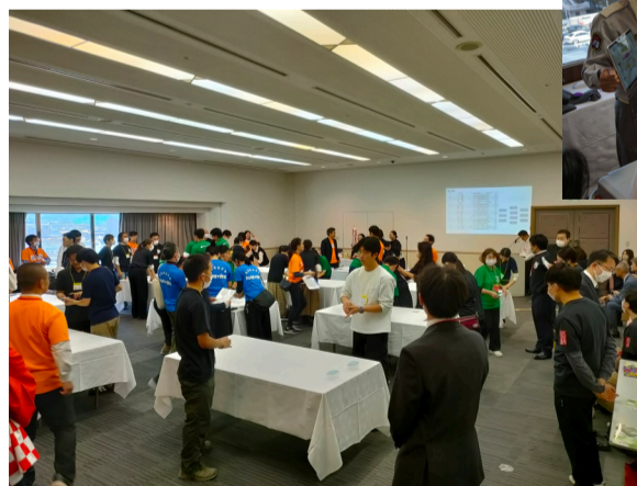
要穴カルタ大会の様子